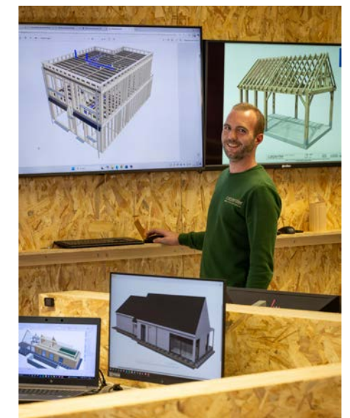
Innovatie zit in het DNA bij Carpentier en dat merk je ook op de nieuwe houtbouwsite.