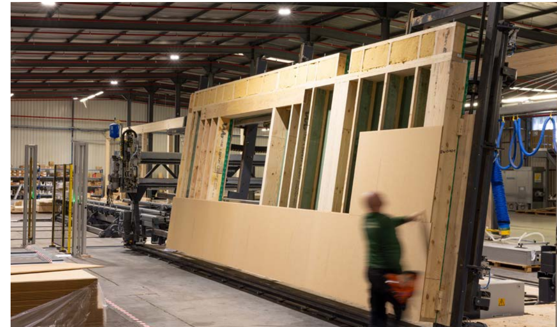
Verregaand offsite bouwen draagt bij aan de snelheid op de werf.