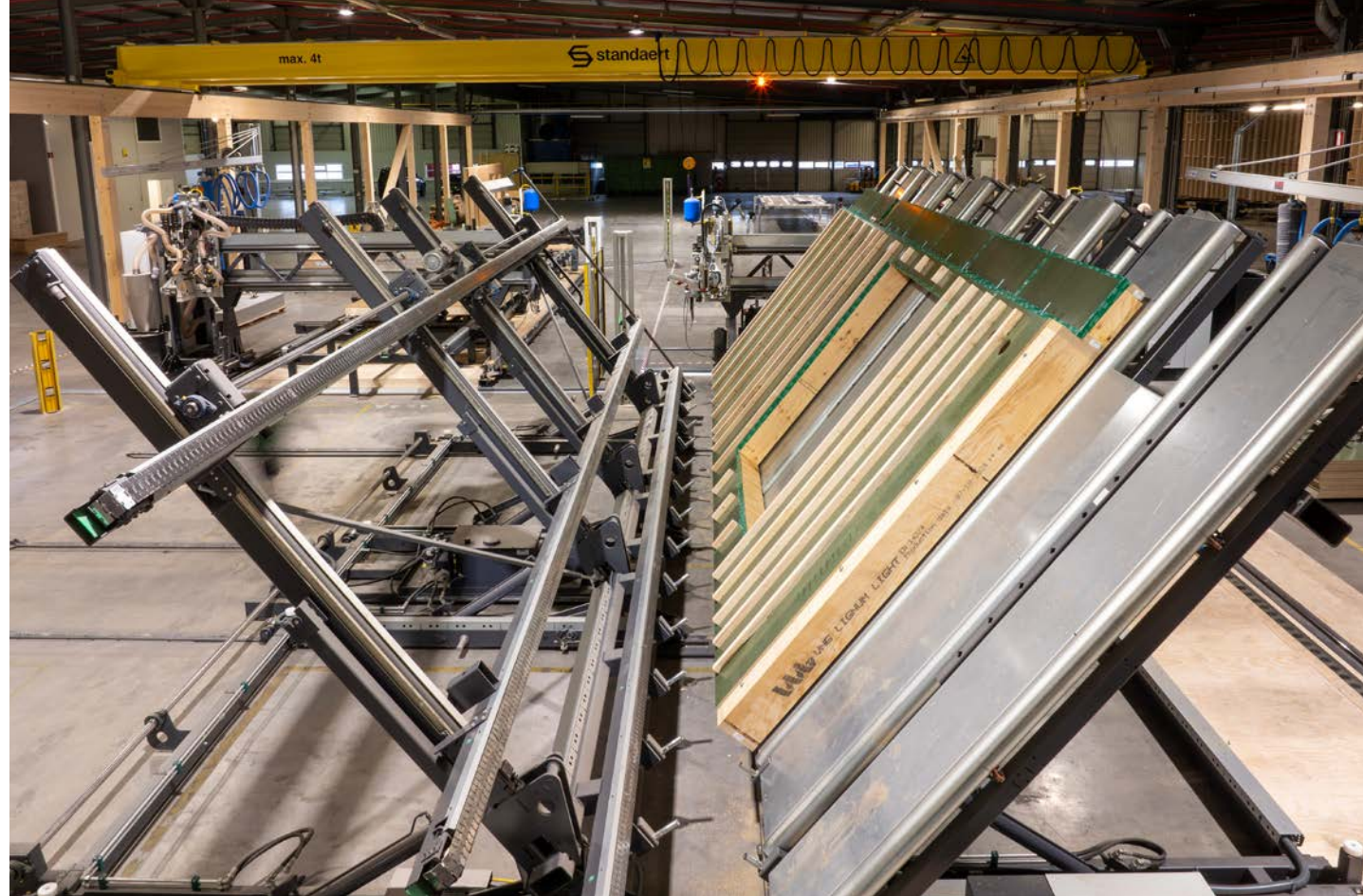
De gloednieuwe HSB-fabriek levert een grote efficiëntie en dat heeft een positieve impact op de productiesnelheid.