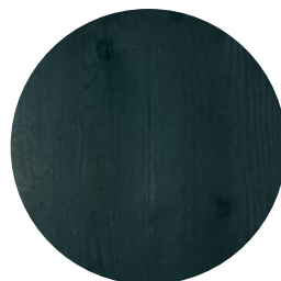
RUBIO MONOCOAT GREEN