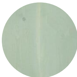
SALT LAKE GREEN