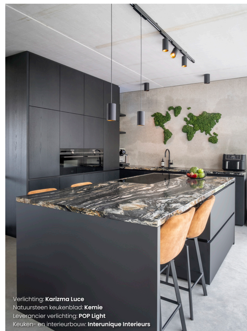
Verlichting: Karizma Luce Natuursteen keukenblad: Kemie Leverancier verlichting: POP Light Keuken- en interieurbouw: Interunique Interieurs

van hoe we het maximale uit de materialen hebben gehaald. De 'jumbo' ruit zit namelijk op de grens van wat technisch mogelijk is. Deze ambitieuze en compromisloze instelling betaalt zich uit in dit prachtige uitzicht." Het interieur is volledig maatwerk volgens ontwerp van skin architects. Vanachter het robuuste kookeiland beleef je het vrije uitzicht over de weilanden. De wand met verticale panelen in de keuken loopt via de woonkamer tot de slaapkamer waardoor eenheid in het ontwerp en de ruimtes ontstaat. Leuk detail in de keuken is de wereldkaart aan de muur. Dit kunstwerk is bekleed met rendiermos. Mooi om te zien; functioneel als het om akoestiek gaat.