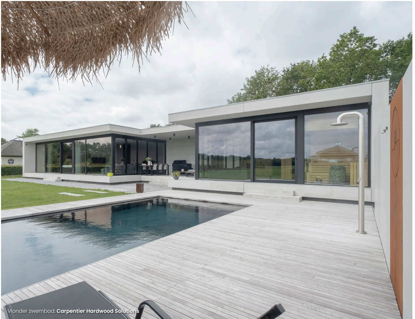
Vlonder zwembad: Carpentier Hardwood Solutions

Oprachtgevers: "Terugkijkend zijn we zeer tevreden met het resultaat. In het ontwerp en materiaalkeuzes hebben we geen concessies gedaan; de woning is gebouwd en ingericht zoals deze door skin architects ontworpen is. Aan kwaliteit en materiaalkeuze is nergens ingeboet. Wij denken dat je daar op lange termijn het meeste plezier van hebt. In de loop der jaren wordt het dan wellicht gedateerd maar klopt het ontwerp nog steeds. Ook in die zin is het een duurzame en tijdloze woning. We zijn nog iedere dag zeer dankbaar dat we deze woning op zo'n mooie en unieke locatie hebben kunnen en mogen bouwen. We zeggen dan ook nog regelmatig tegen elkaar: 'Wat mooi, je zult daar mogen wonen!'"