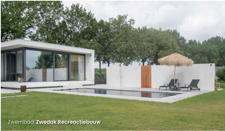
Zwembad: Zwedak Recreatiebouw

Oprachtgevers: "Terugkijkend zijn we zeer tevreden met het resultaat. In het ontwerp en materiaalkeuzes hebben we geen concessies gedaan; de woning is gebouwd en ingericht zoals deze door skin architects ontworpen is. Aan kwaliteit en materiaalkeuze is nergens ingeboet. Wij denken dat je daar op lange termijn het meeste plezier van hebt. In de loop der jaren wordt het dan wellicht gedateerd maar klopt het ontwerp nog steeds. Ook in die zin is het een duurzame en tijdloze woning. We zijn nog iedere dag zeer dankbaar dat we deze woning op zo'n mooie en unieke locatie hebben kunnen en mogen bouwen. We zeggen dan ook nog regelmatig tegen elkaar: 'Wat mooi, je zult daar mogen wonen!'"