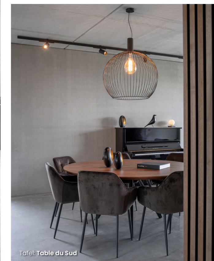
Tafel: Table du Sud