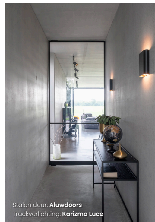
Stalen deur: Aluudoors Trackverlichting: Karizma Luce